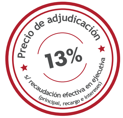
Ejemplo de Cuadro de Mando de Gestión de Ejecutiva