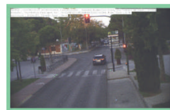
3.- DESPUÉS de pasar semáforo en rojo