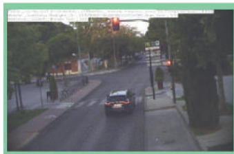
1.- ANTES de pasar semáforo en rojo